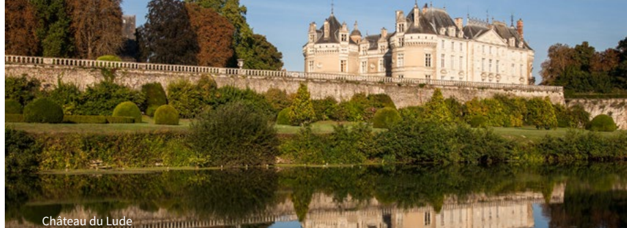
Château du Lude