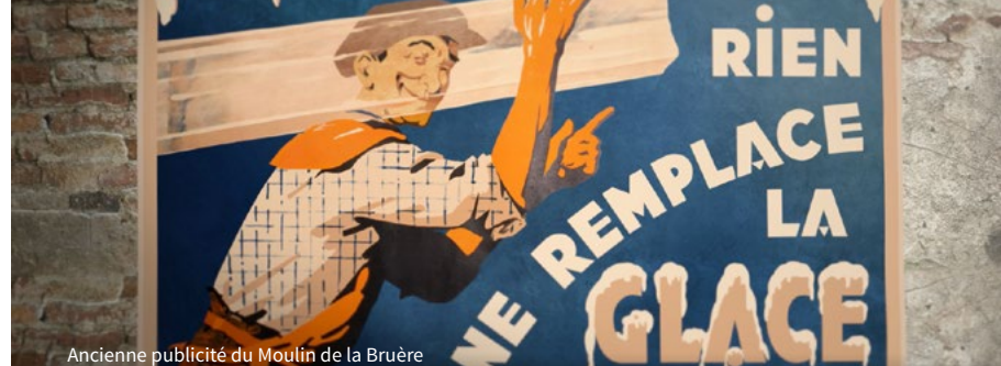
Ancienne publicité du Moulin de la Bruère