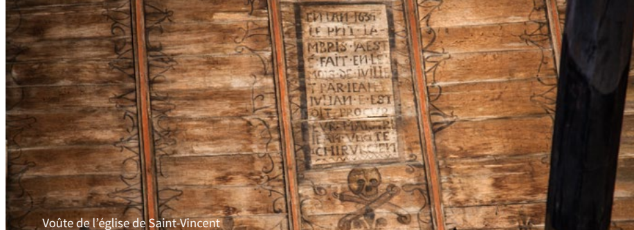
Voûte de l'église de Saint-Vincent