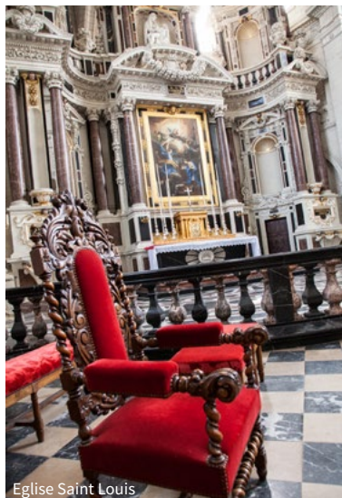
Eglise Saint Louis